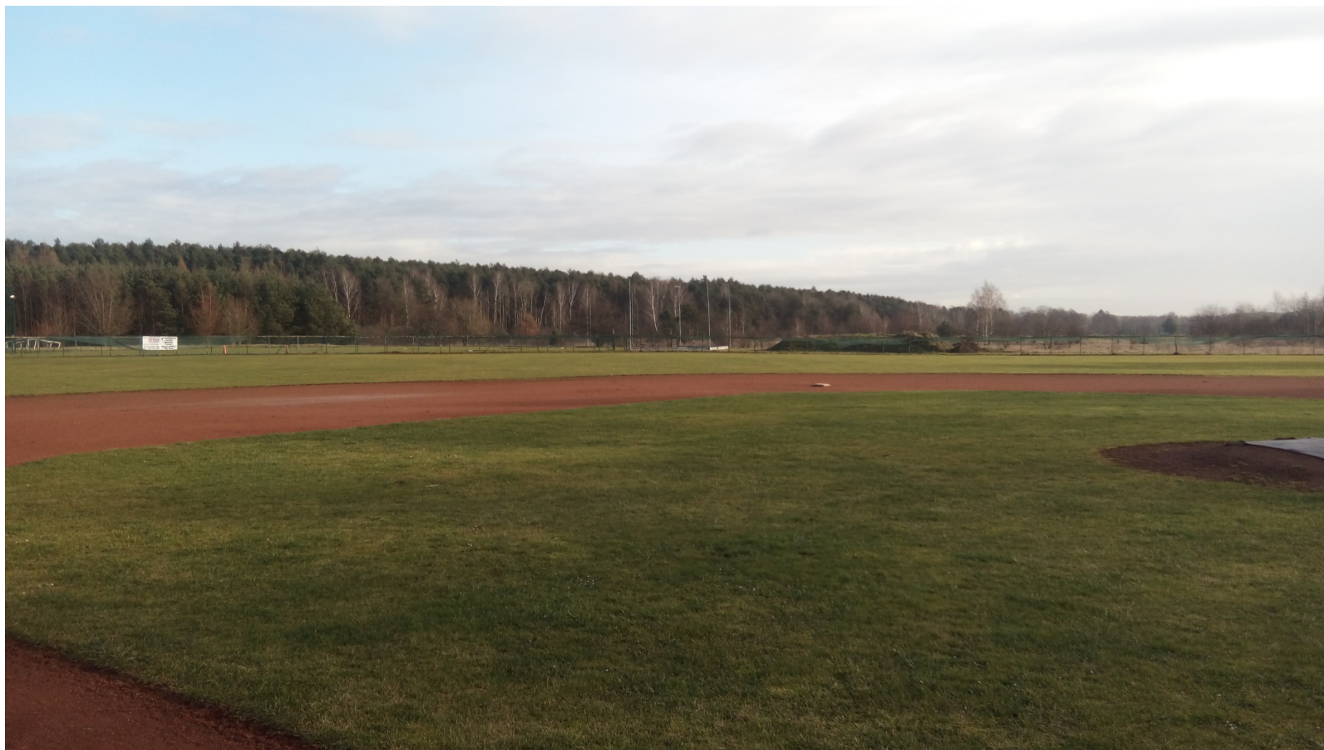
Zdjęcie nr 11 – widok obiektu