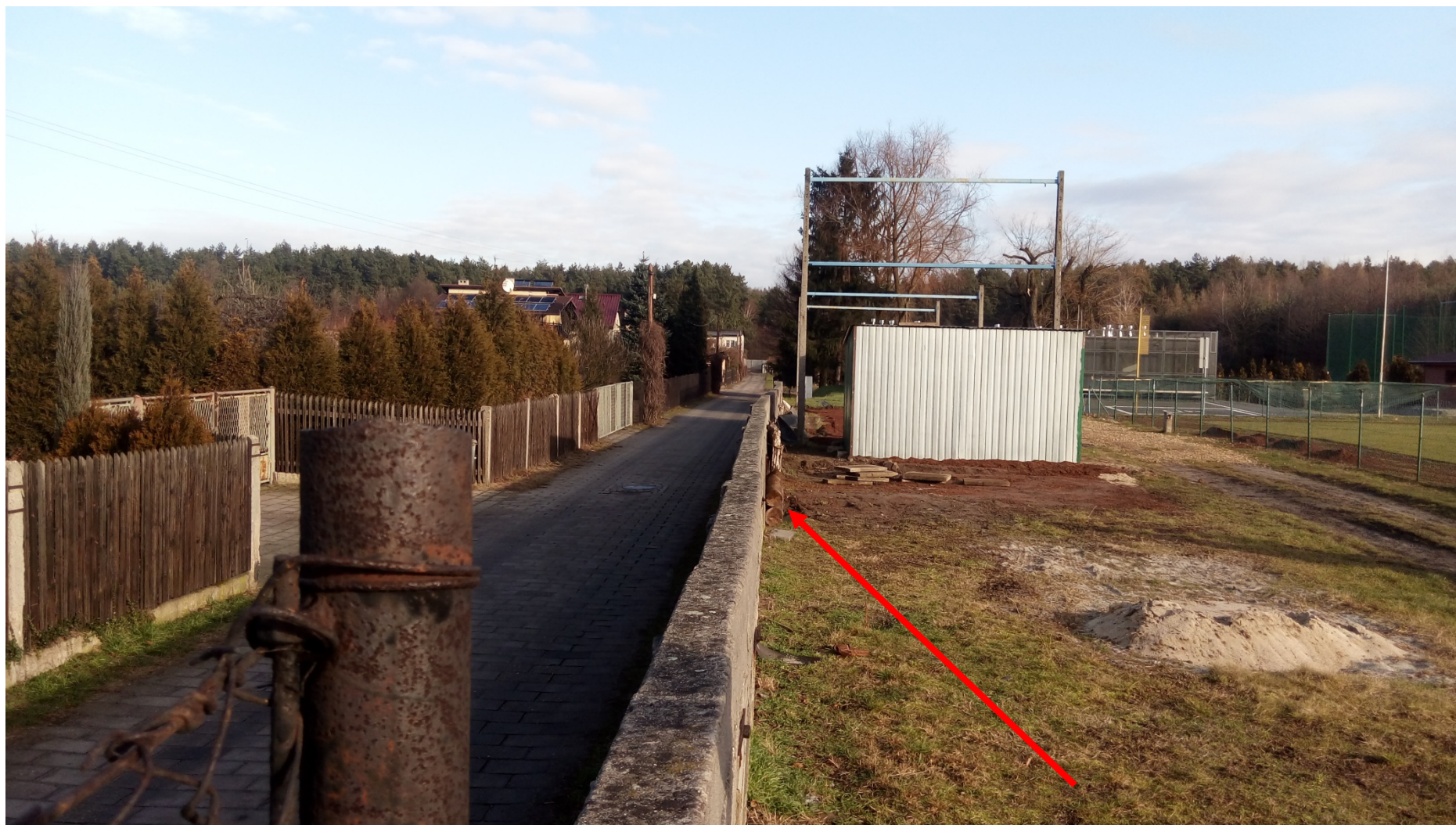
Zdjęcie nr 4 – istniejące ogrodzenie od strony drogi dojazdowej (mur oporowy)