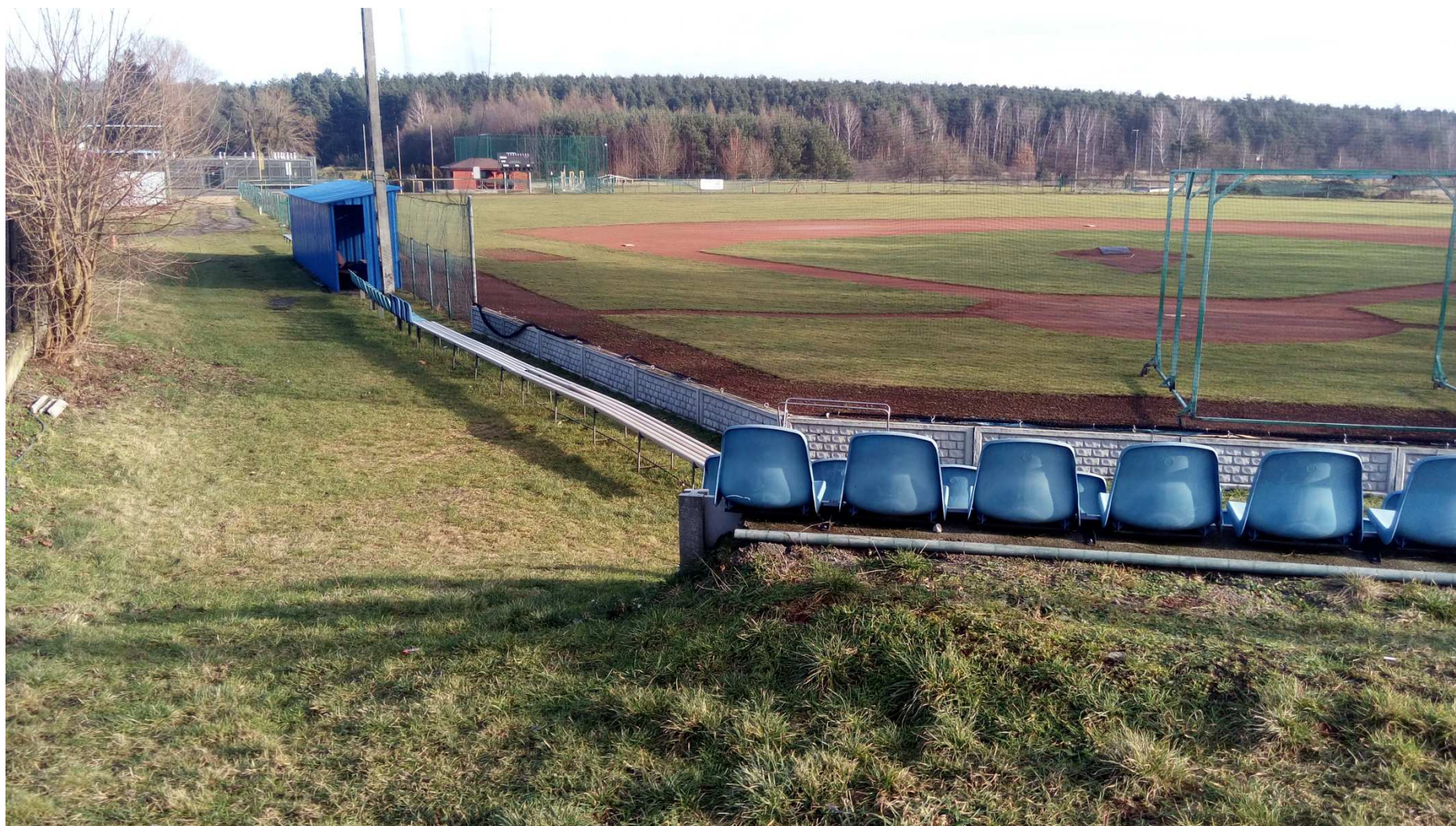
Zdjęcie nr 12 – widok obiektu