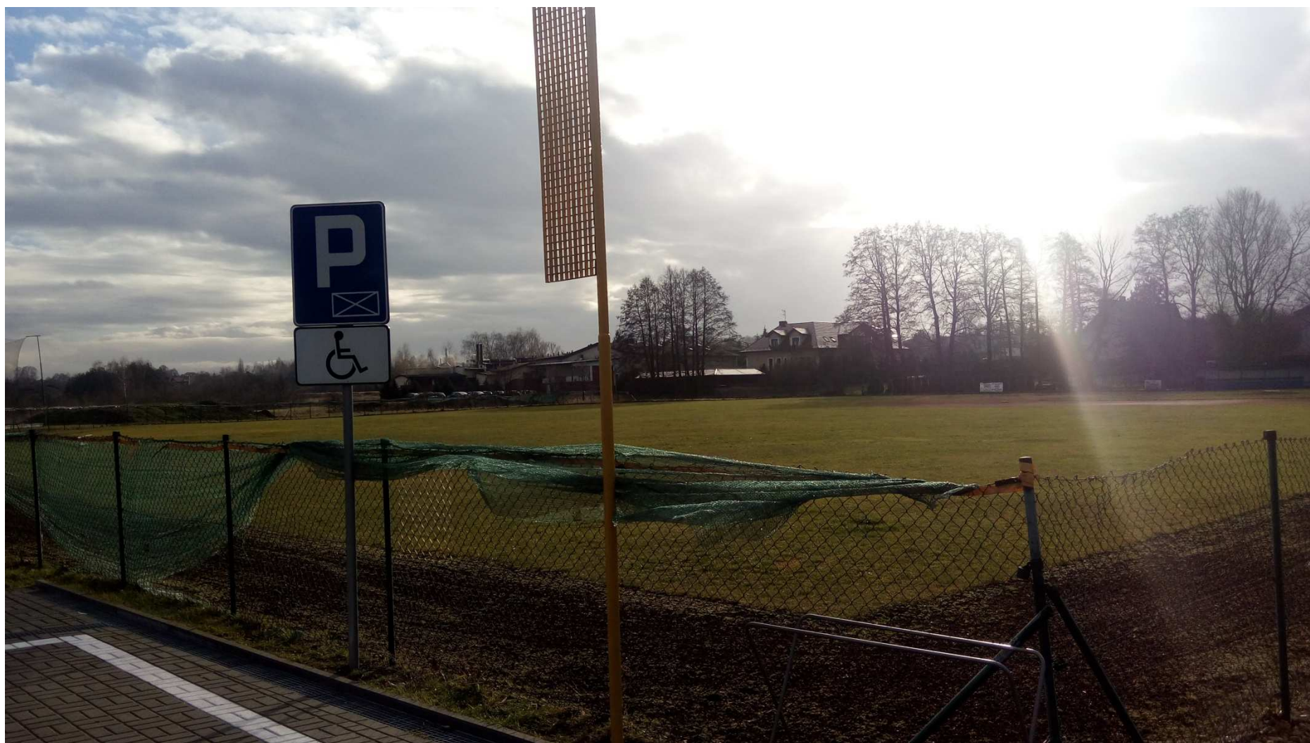
Zdjęcie nr 16 – widok obiektu