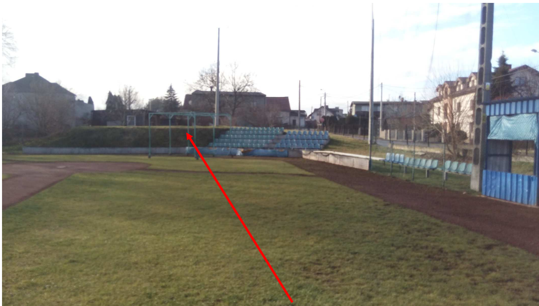
Zdjęcie nr 6 – lokalizacja trybun (widok 2)