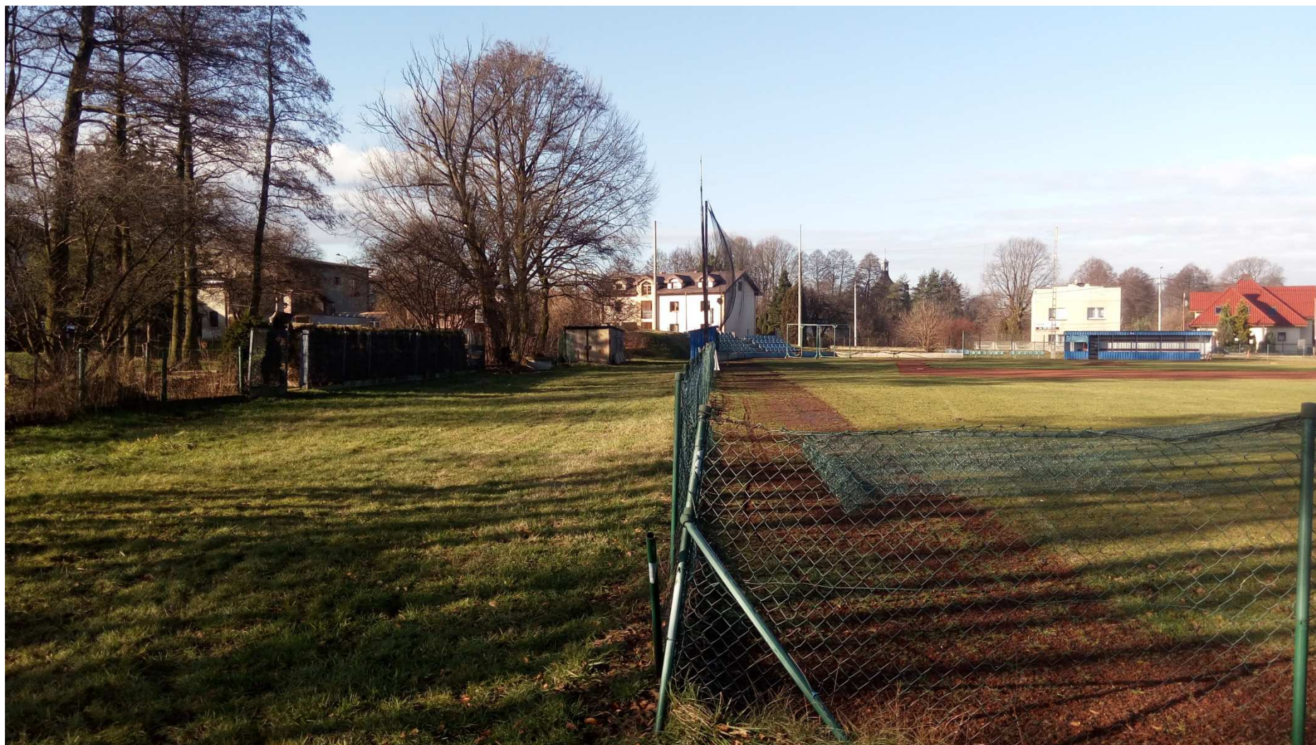
Zdjęcie nr 14 – widok obiektu