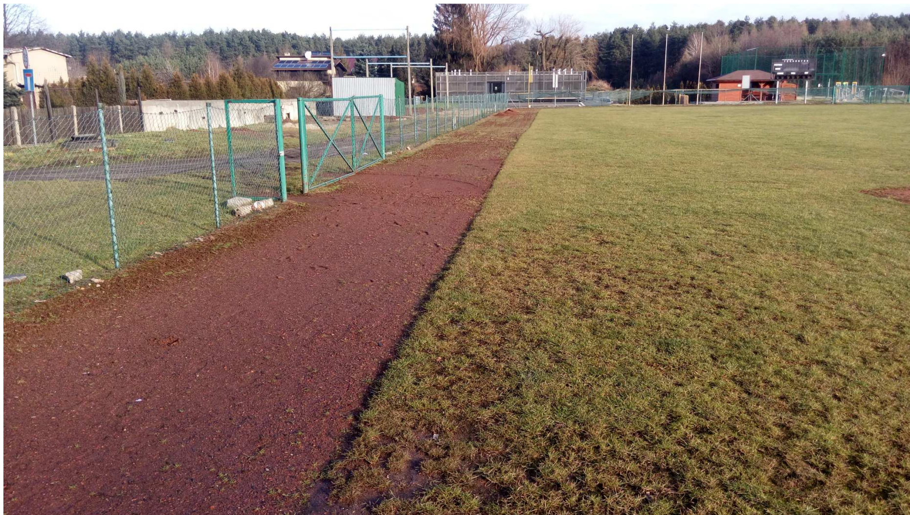
Zdjęcie nr 9 – widok obiektu