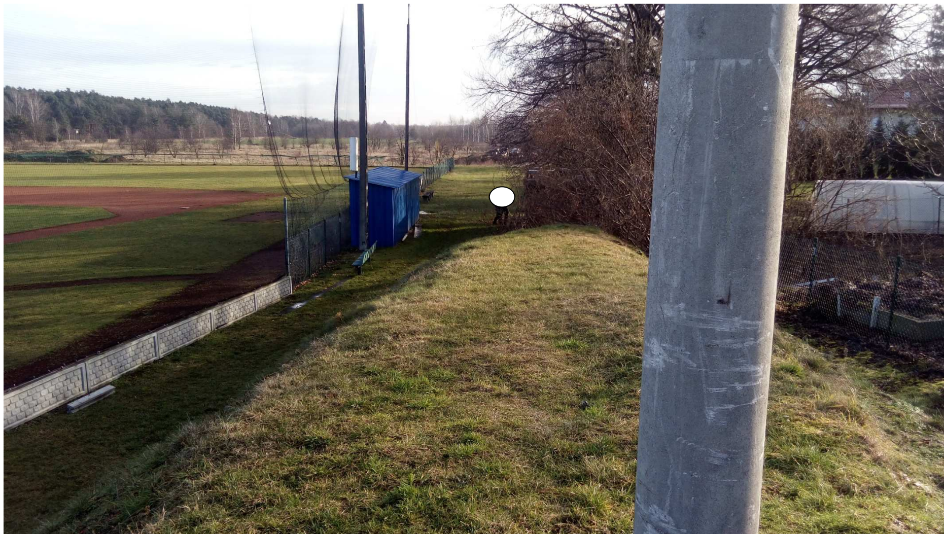
Zdjęcie nr 13 – widok obiektu