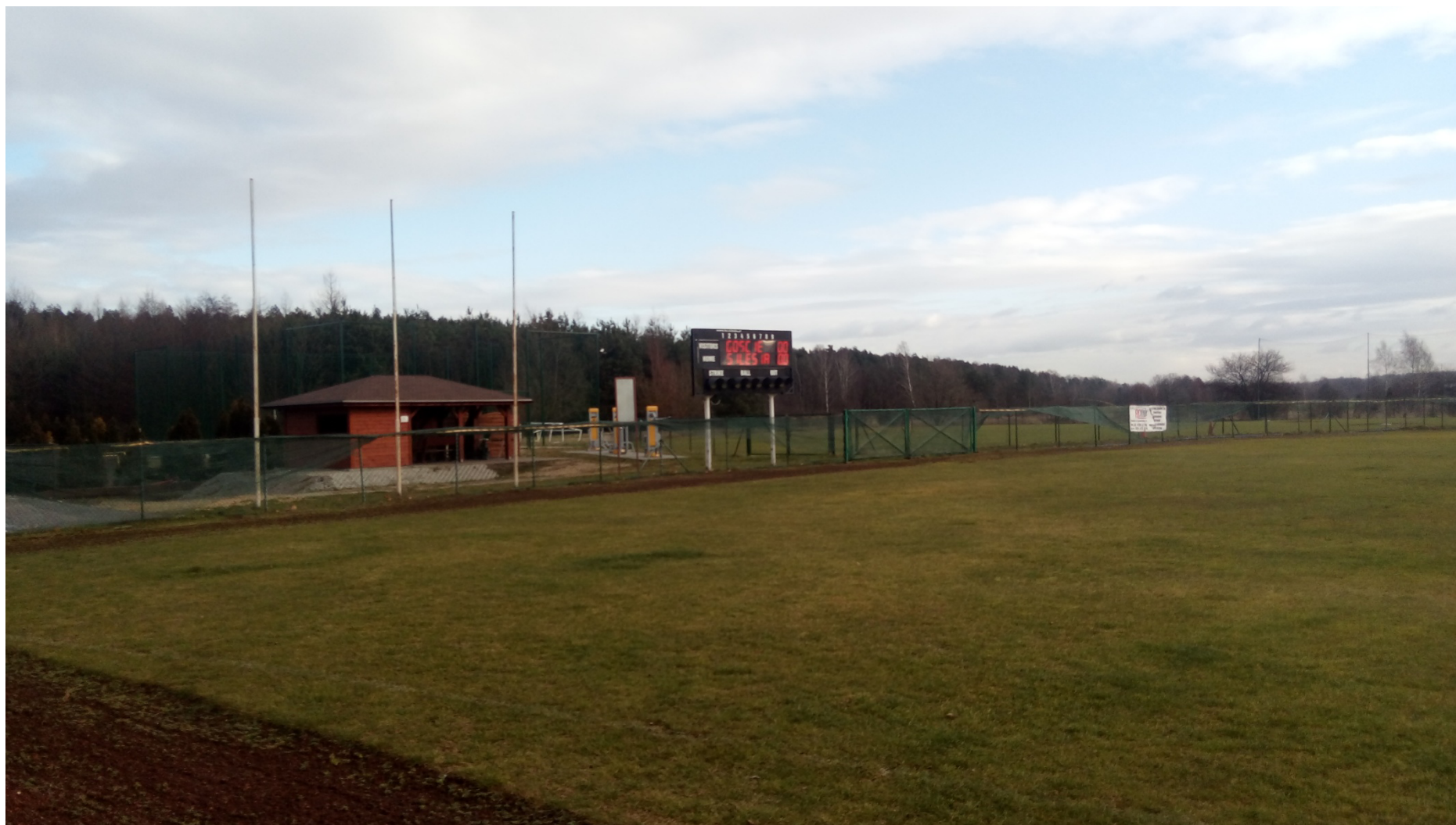
Zdjęcie nr 8 – widok obiektu