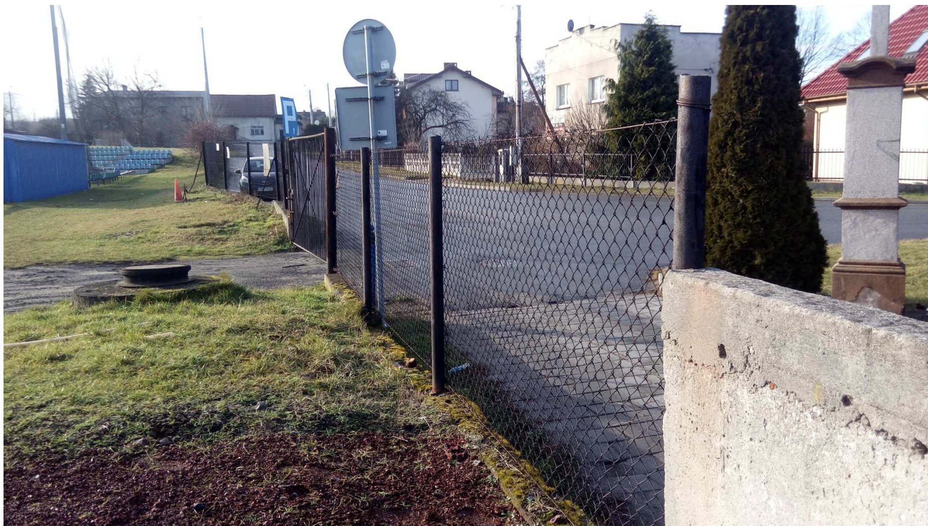
Zdjęcie nr 2 – istniejące ogrodzenie od strony drogi dojazdowej (do przebudowy)