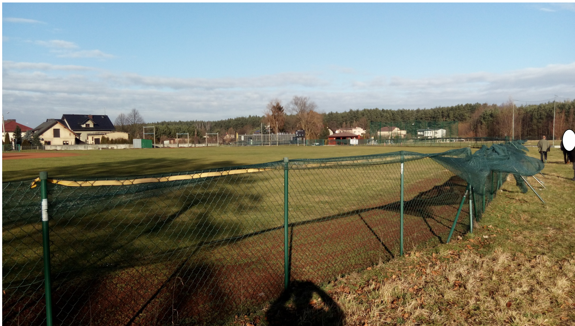
Zdjęcie nr 15 – widok obiektu