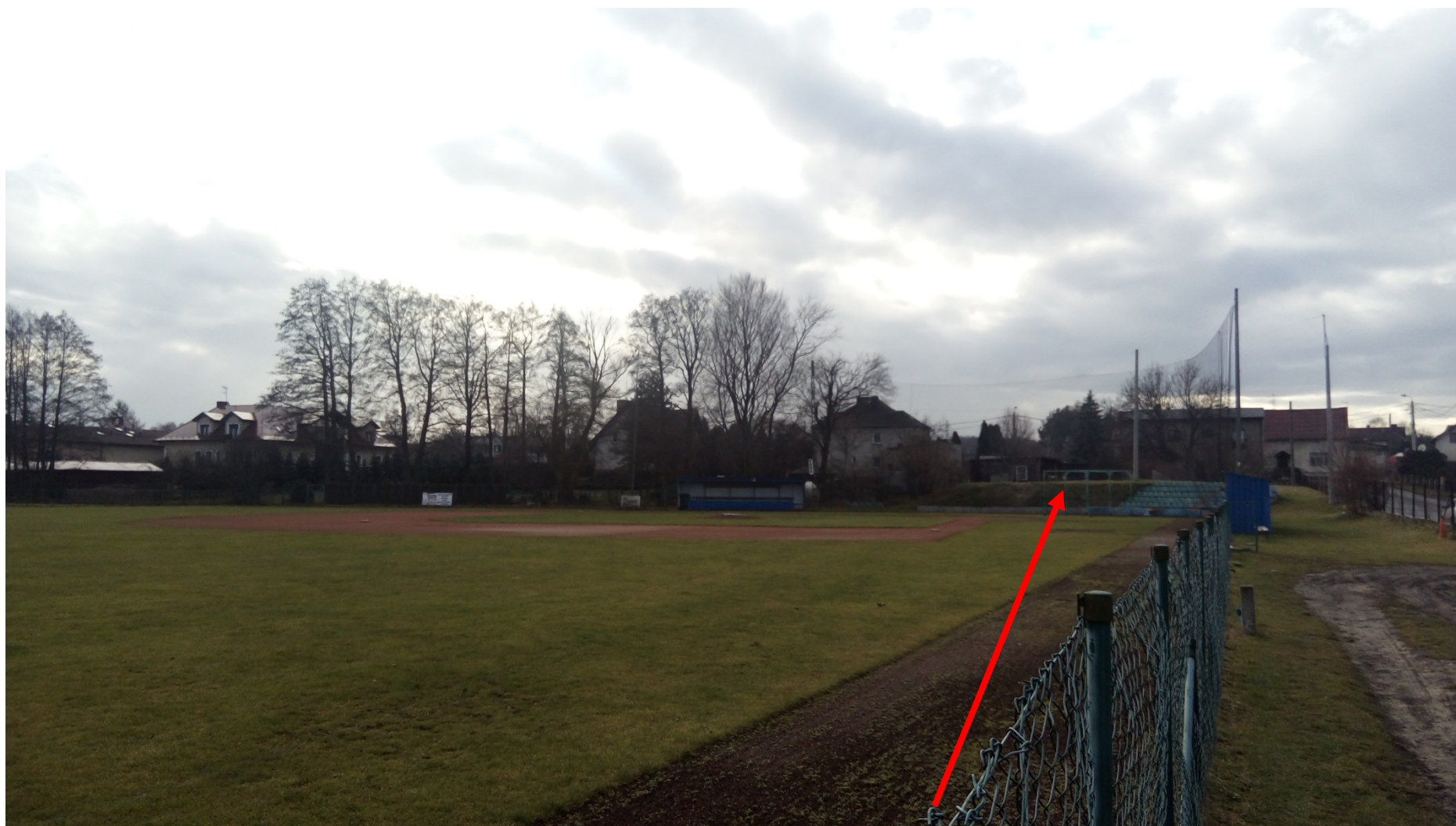
Zdjęcie nr 5 – widok obiektu i lokalizacja trybun