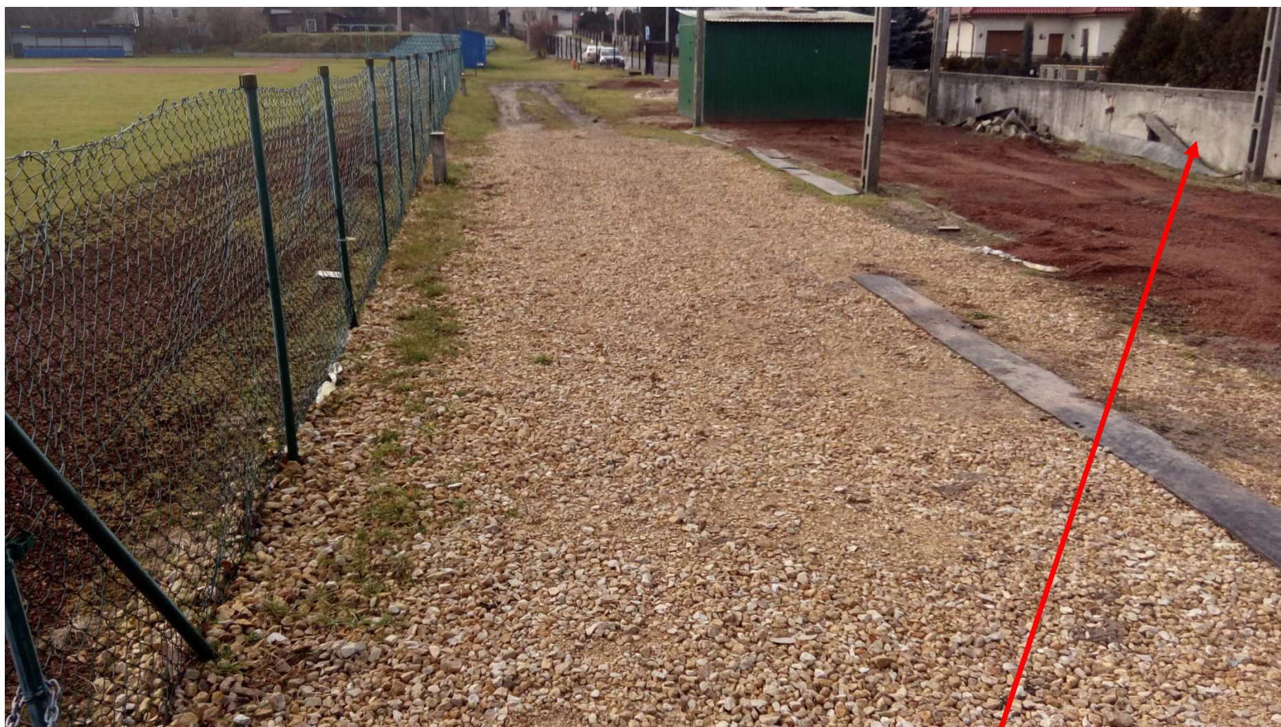
Zdjęcie nr 3 – istniejące ogrodzenie od strony drogi dojazdowej do przebudowy (mur oporowy)