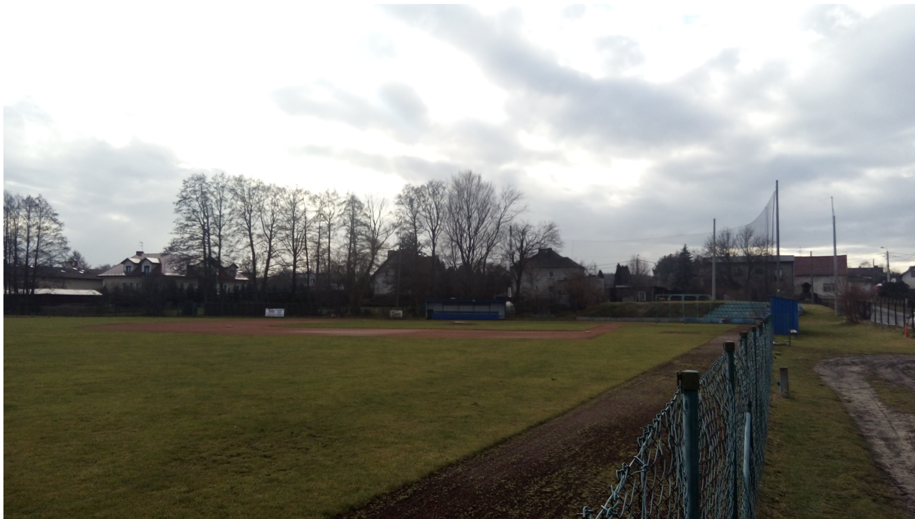
Zdjęcie nr 7 – widok obiektu