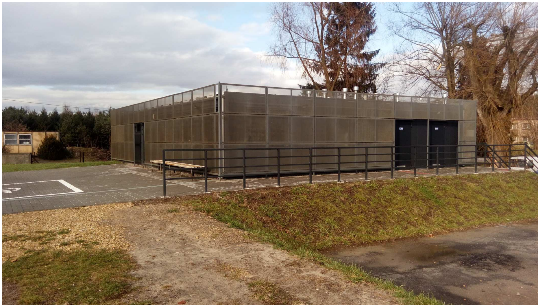
Zdjęcie nr 1 – istniejący budynek zaplecza szatniowego obiektu (poza zakresem opracowania)