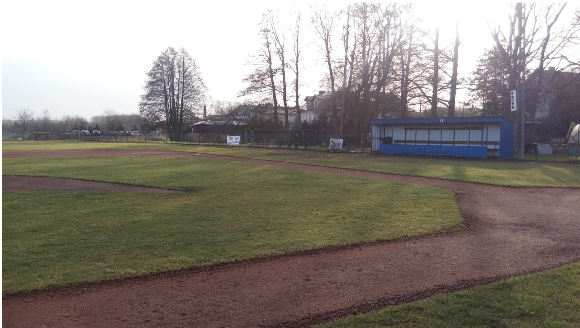
Zdjęcie nr 10 – widok obiektu