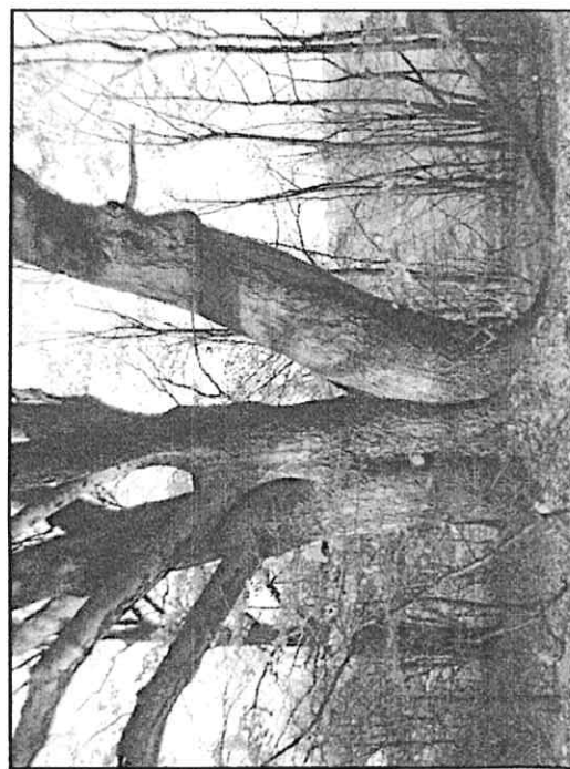
Fot. 2 Podstawa drzewa od strony wschodniej