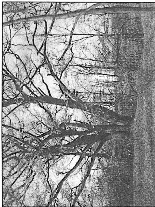
Fot. 1 Buk widoczny od strony wschodniej