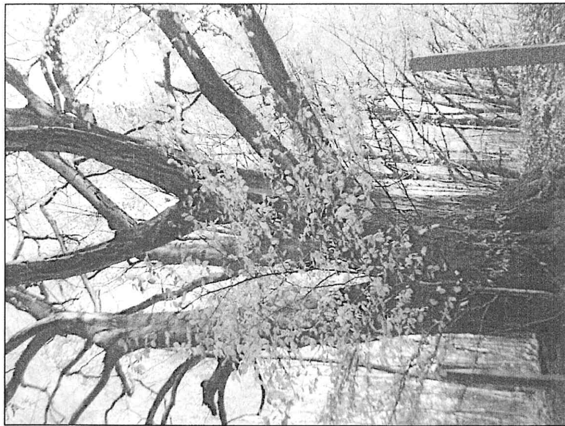
Fot. 3 Drzewo od strony zachodniej