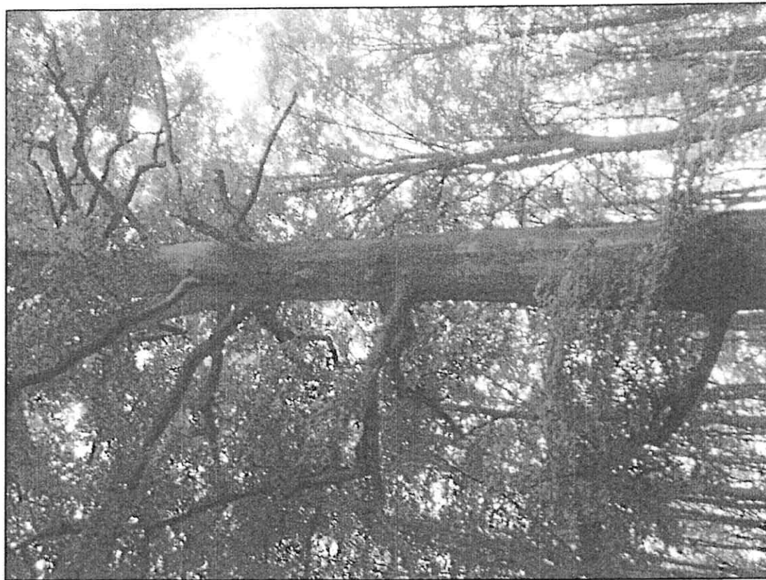
Fot. 2 Korona drzewa