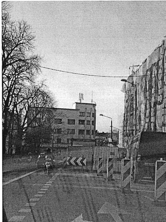
Zał. nr 1: Widok ogólny badanego obiektu.