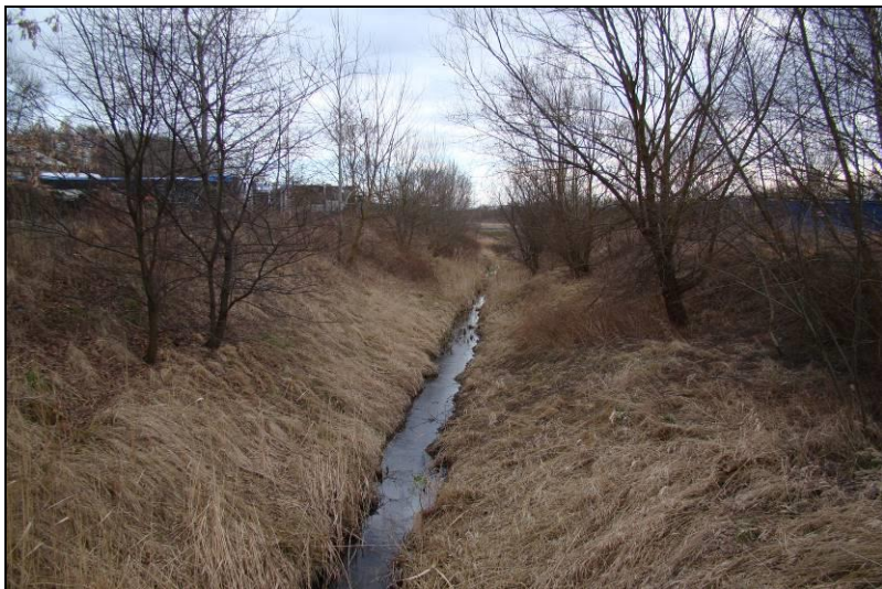
Fot. 21 Młynówka we wschodniej części obszaru nr 3