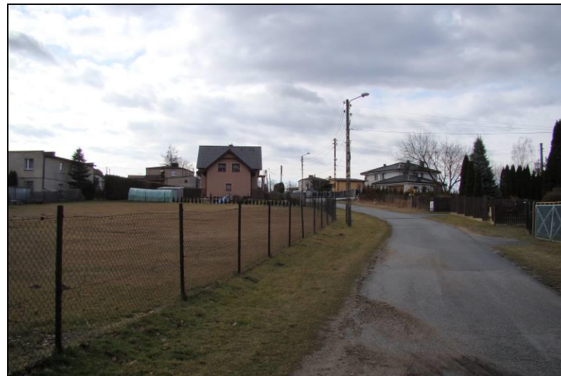
Fot. 7 Ul. Samotna, północno-zachodnia część obszaru