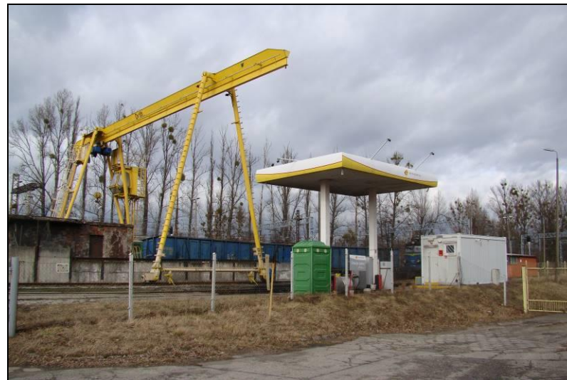
Fot. 15 Tereny kolejowe w centralnej części obszaru nr 3