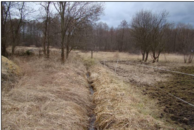
Fot. 5 Ciek w północnej części terenu nr 1