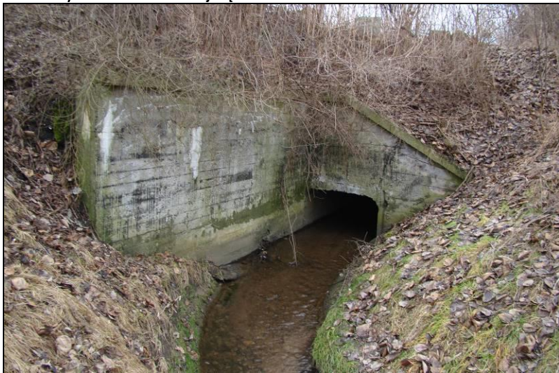
Fot. 22 Młynówka, wypływ z kanału od strony ul. Bolesława Chrobrego