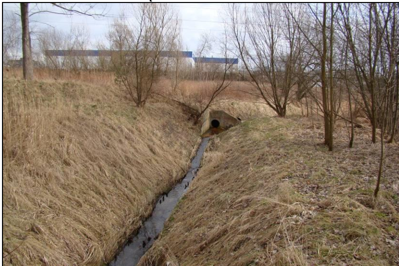
Fot. 18 Ciek Młynówka przepływający przez centralną część obszaru nr 3