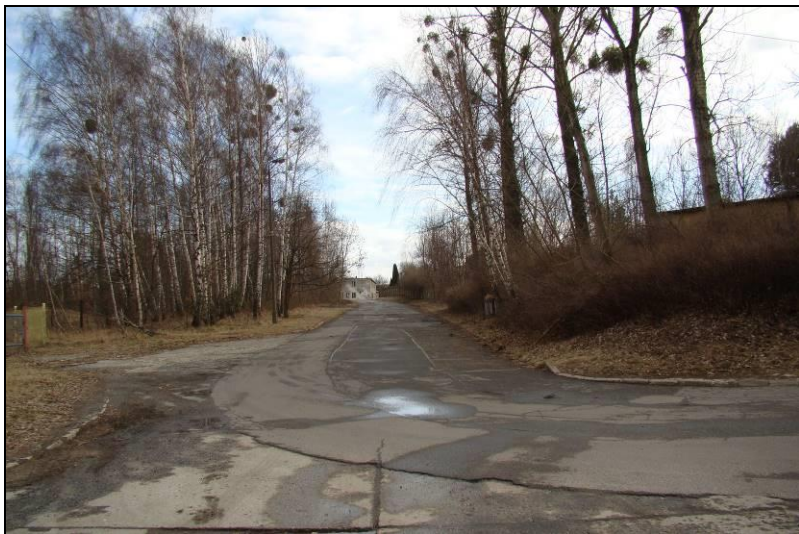
Fot. 13 Połączenie ul. J. Giedroycia z ul. Kolejową