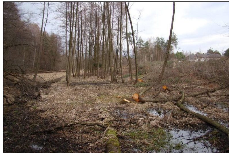
Fot. 27 Ciek na fragmencie zachodniej części terenu nr 4