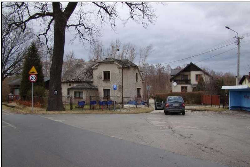
Fot. 1 Teren nr 1, skrzyżowanie ul. Poloczka i ul. Skowronków