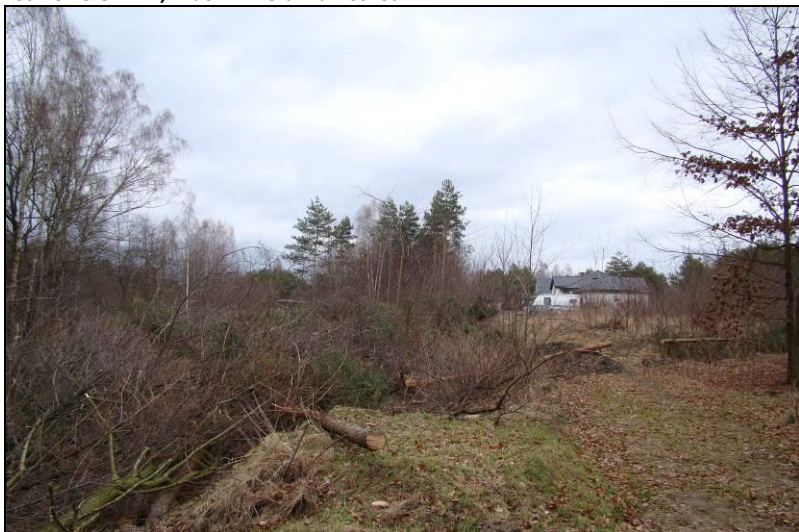
Fot. 26 Północna część analizowanego obszaru