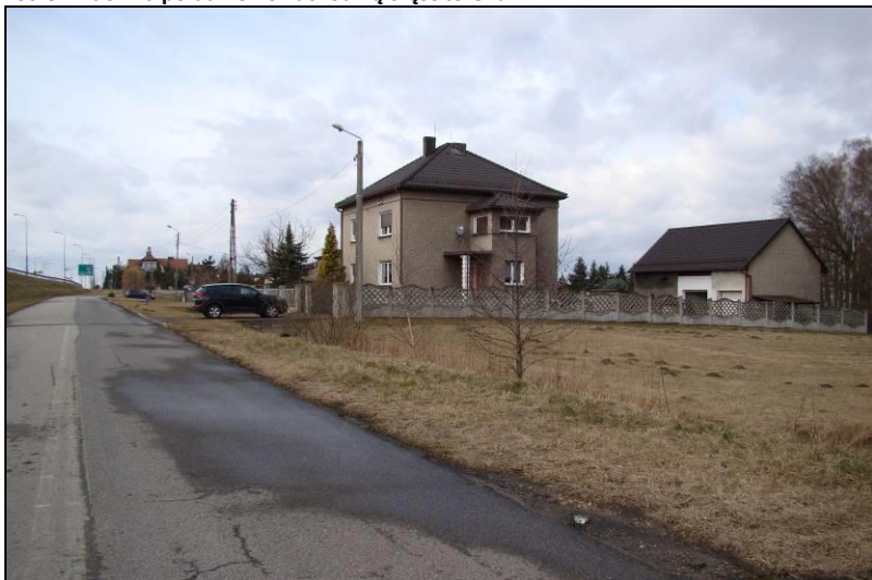
Fot. 10 Jak powyżej