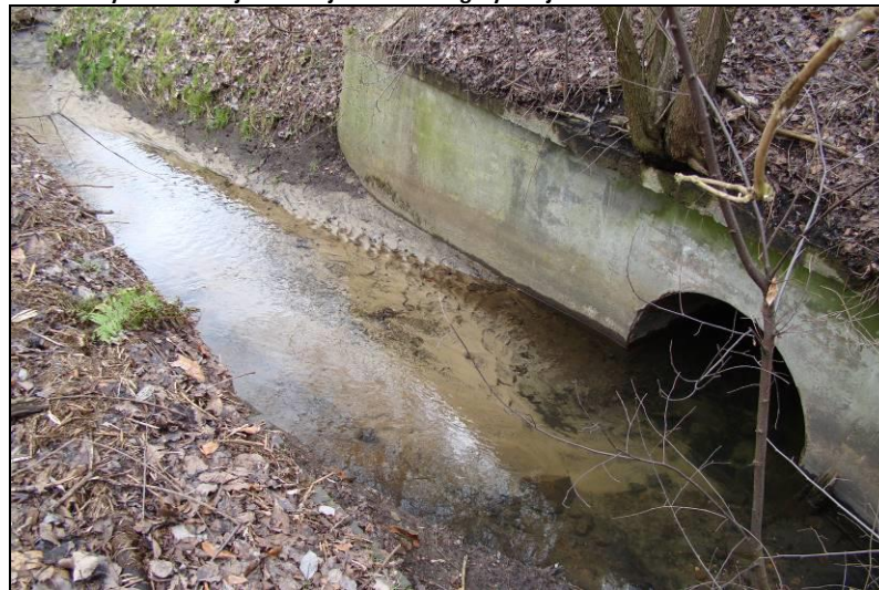
Fot. 20 Młynówka na wpływie do przepustu pod nasypem kolejowym