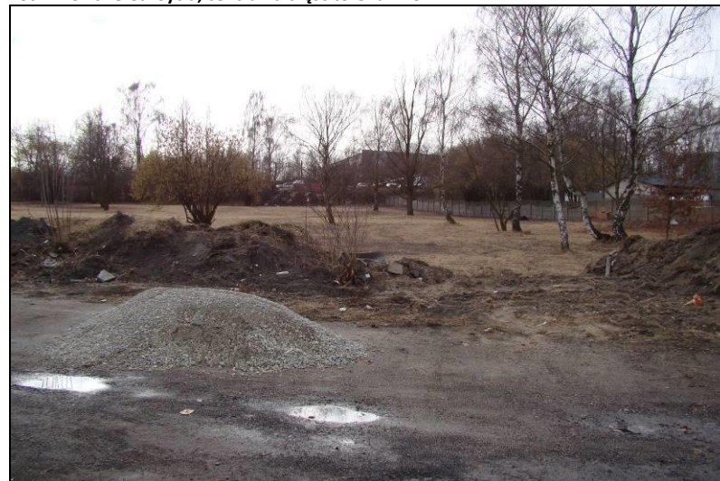
Fot. 12 Tereny na zachód od ul. J. Giedroycia