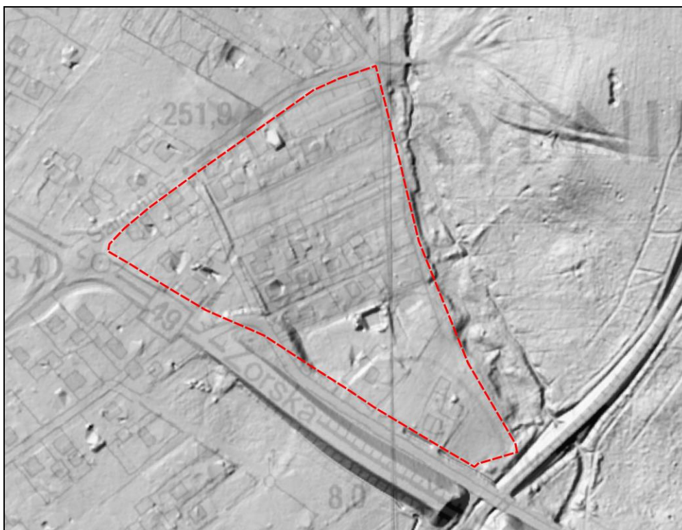
Rysunek 2 Ukształtowanie terenu nr 2 na podstawie Numerycznego Model Terenu

Teren nr 2 położony jest na niewielkim zboczu lokalnej dolinki cieku bez nazwy. Powierzchnia opada nieznacznie w kierunku północno-zachodnim, w kierunku doliny Rudy. Rzędne wynoszą tu ok. 253 m n.p.m. w części południowo-zachodniej, 243 m n.p.m. w części północno-zachodniej oraz 249 m n.p.m. w części południowo-wschodniej.