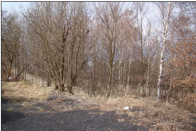
Fot. 17 Południowo-zachodnia część terenu nr 3