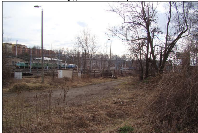
Fot. 24 Tereny na przedłużeniu ul. Bolesława Chrobrego w kierunku na zachód