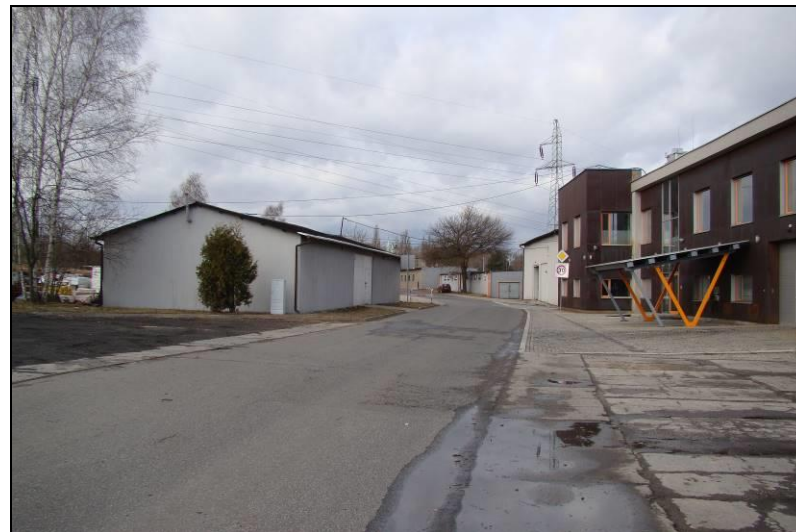
Fot. 11 Ul. J. Giedroycia, centralna część terenu nr 3