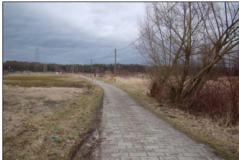
Fot. 3 Północna część terenu nr 1