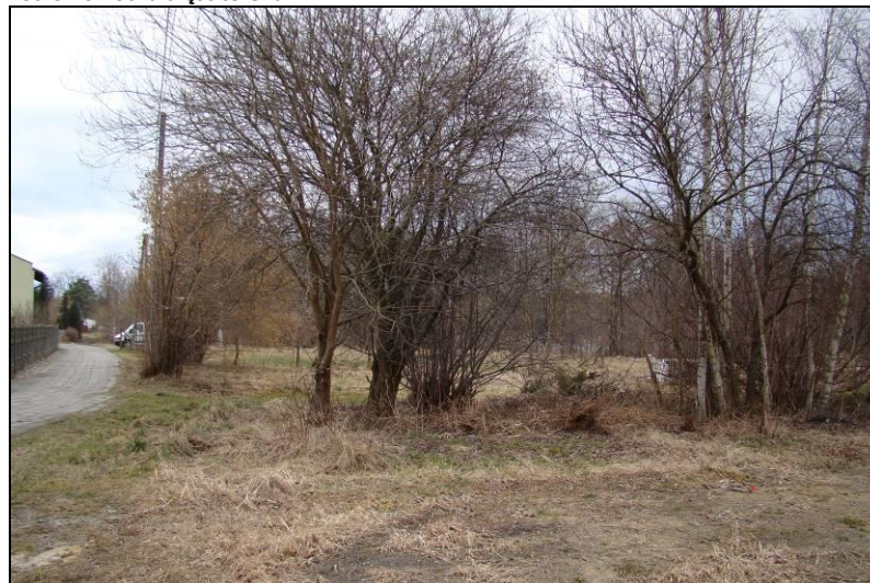
Fot. 4 Północno-zachodnia część terenu nr 1