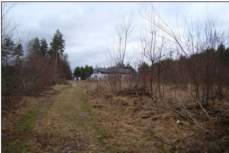
Fot. 25 Teren nr 4, widok w kierunku wschodnim