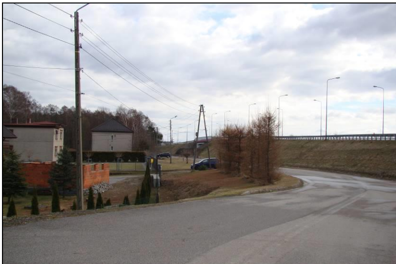
Fot. 9 Widok na południowo-zachodnią część terenu nr 2