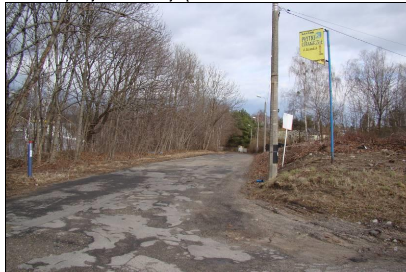
Fot. 16 Ul. Kolejowa, zachodnia część obszaru nr 3