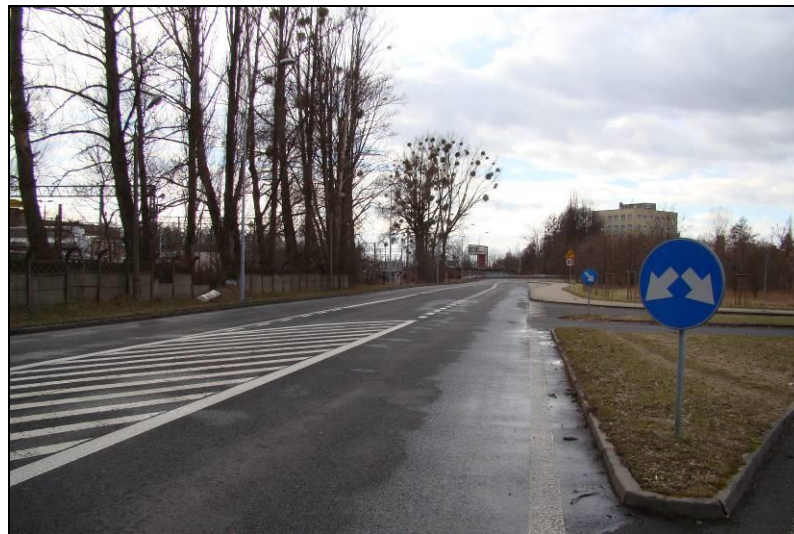
Fot. 23 Ul. Bolesława Chrobrego, północno-zachodnia część obszaru