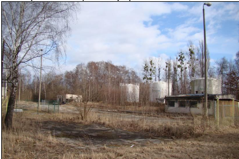
Fot. 14 Tereny na przedłużeniu ul. Kolejowej