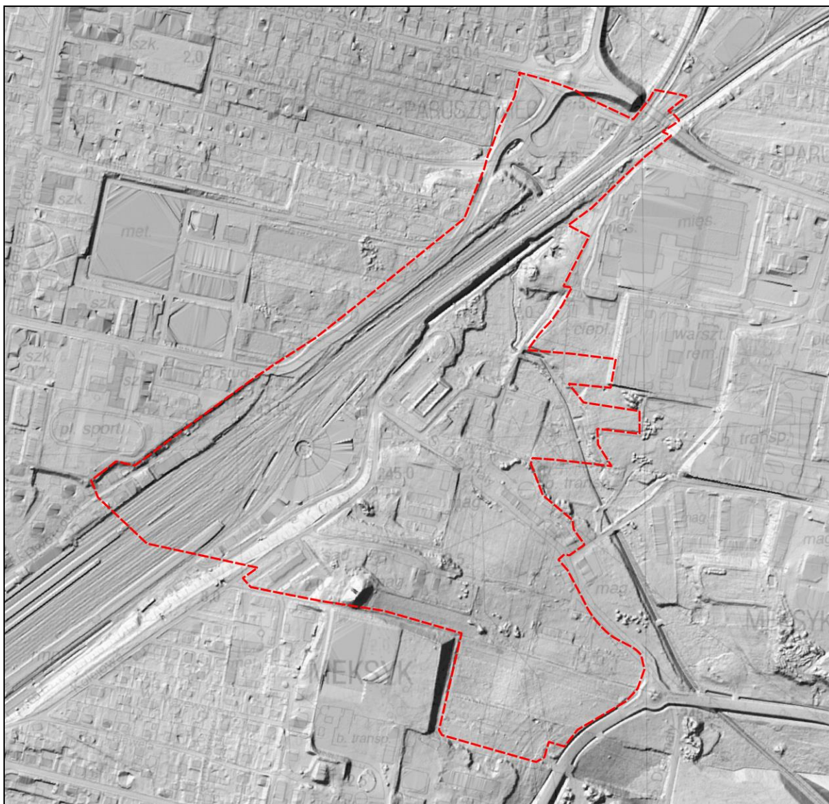
Teren nr 4 położony jest na zboczu lokalnego cieku bez nazwy, powierzchnia opada tu w kierunku zachodnim. Rzędne w części wschodniej wynoszą ok. 260 m n.p.m., zaś w części zachodniej, w dolince cieku ok. 252 m n.p.m.