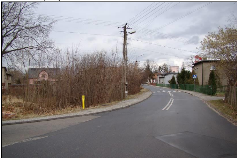
Fot. 2 Południowa część terenu nr 1, ul. Poloczka