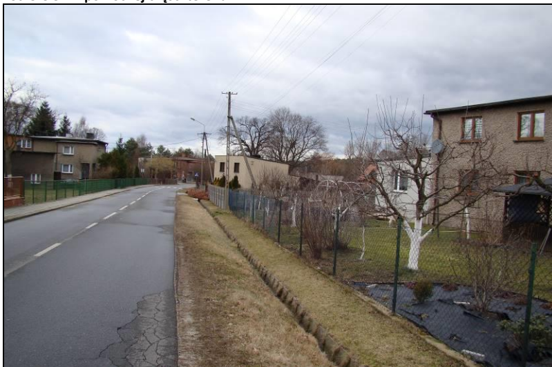
Fot. 6 Ul. Poloczka, południowo-wschodnia część terenu