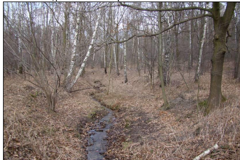
Fot. 8 Ciek poza północno-wschodnią granicą obszaru nr 2