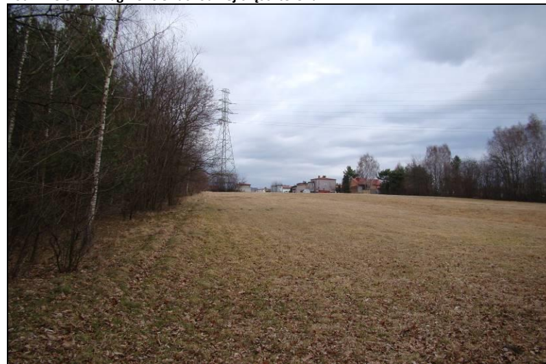
Fot. 28 Tereny rolne w południowo-wschodniej części obszaru nr 4