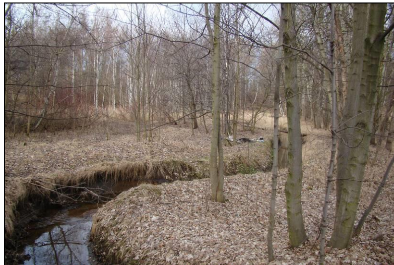
Fot. 19 Młynówka w rejonie stacji elektroenergetycznej