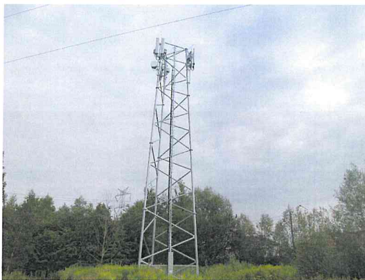
Załącznik nr 1: Widok ogólny instalacji radiokomunikacyjnej.

Koniec sprawozdania. Sprawozdanie zawiera dodatkowo załączniki nr 1 i 2.