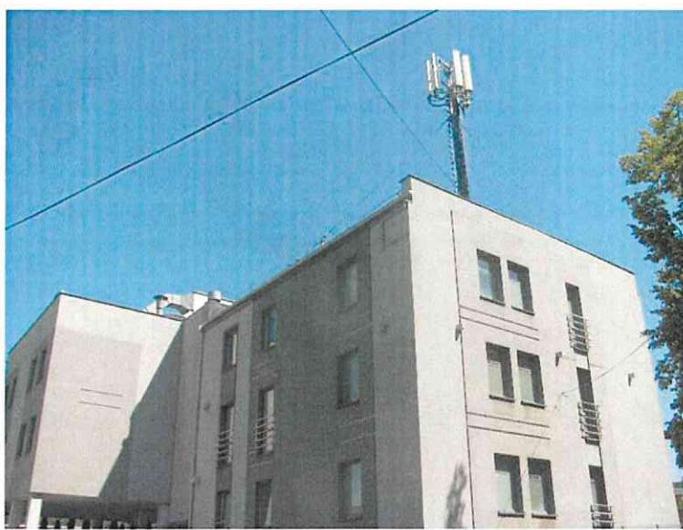
Załącznik nr 1: Widok ogólny instalacji radiokomunikacyjnej.