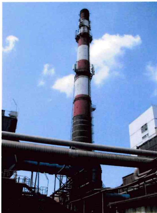
Zał. nr 1: Widok ogólny instalacji radiokomunikacyjnej.

Koniec sprawozdania. Sprawozdanie zawiera dodatkowo załączniki nr 1 i 2.