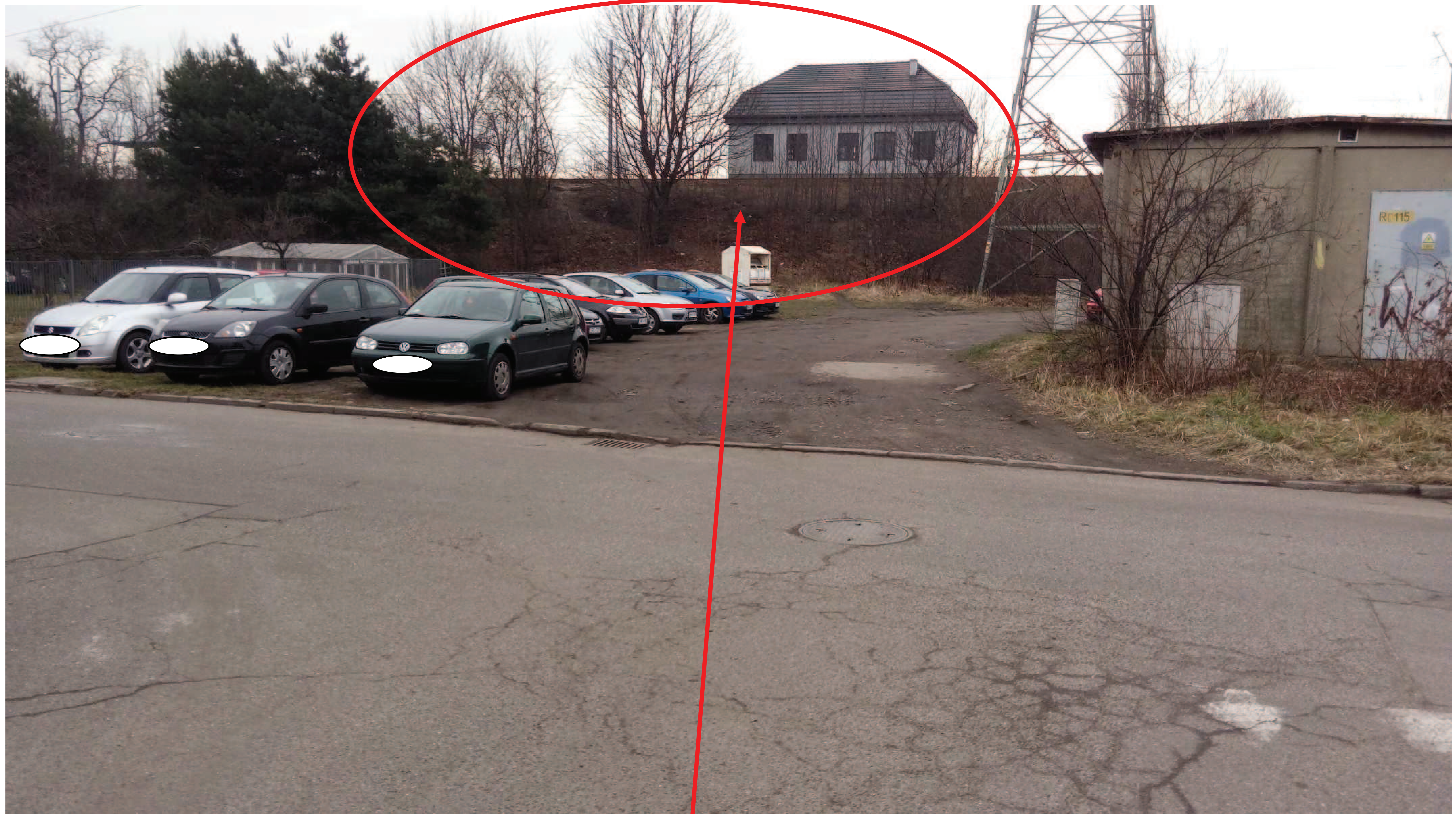
Drzewa i zieleń do usunięcia