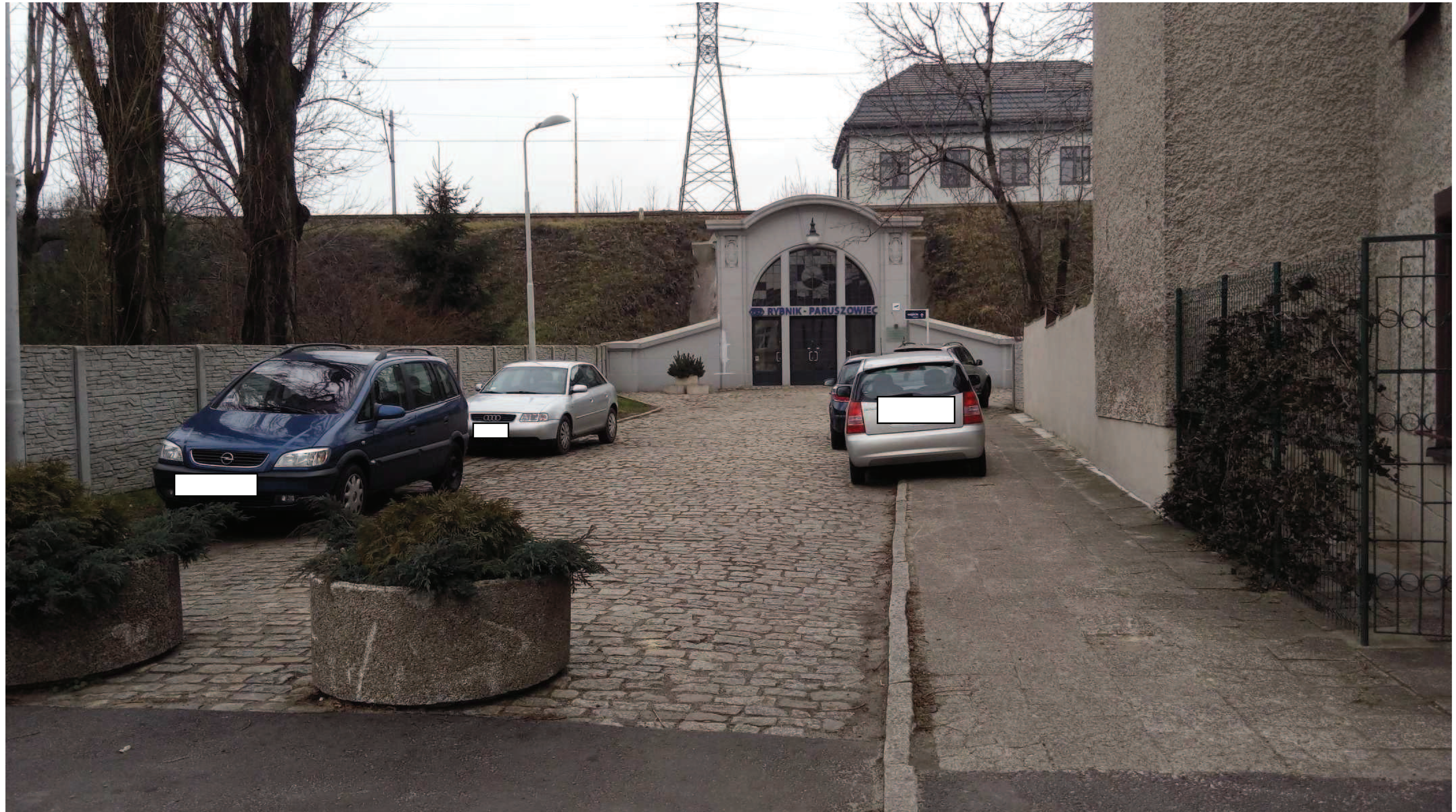
Widok od strony ul. Mikołowskiej (2)