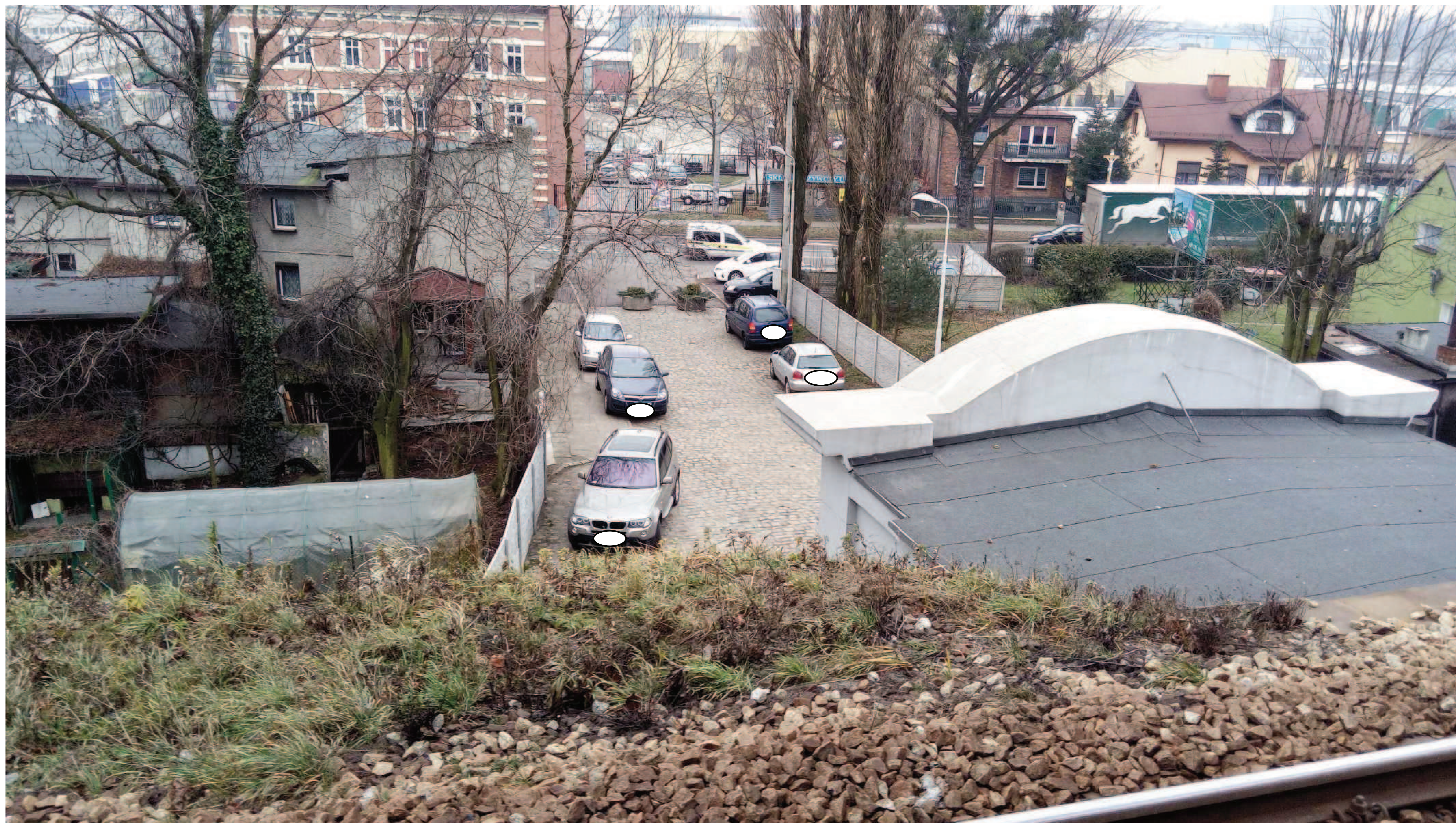
Widok od strony ul. Mikołowskiej (4) z nasypu (1) – od strony stacji kolejowej