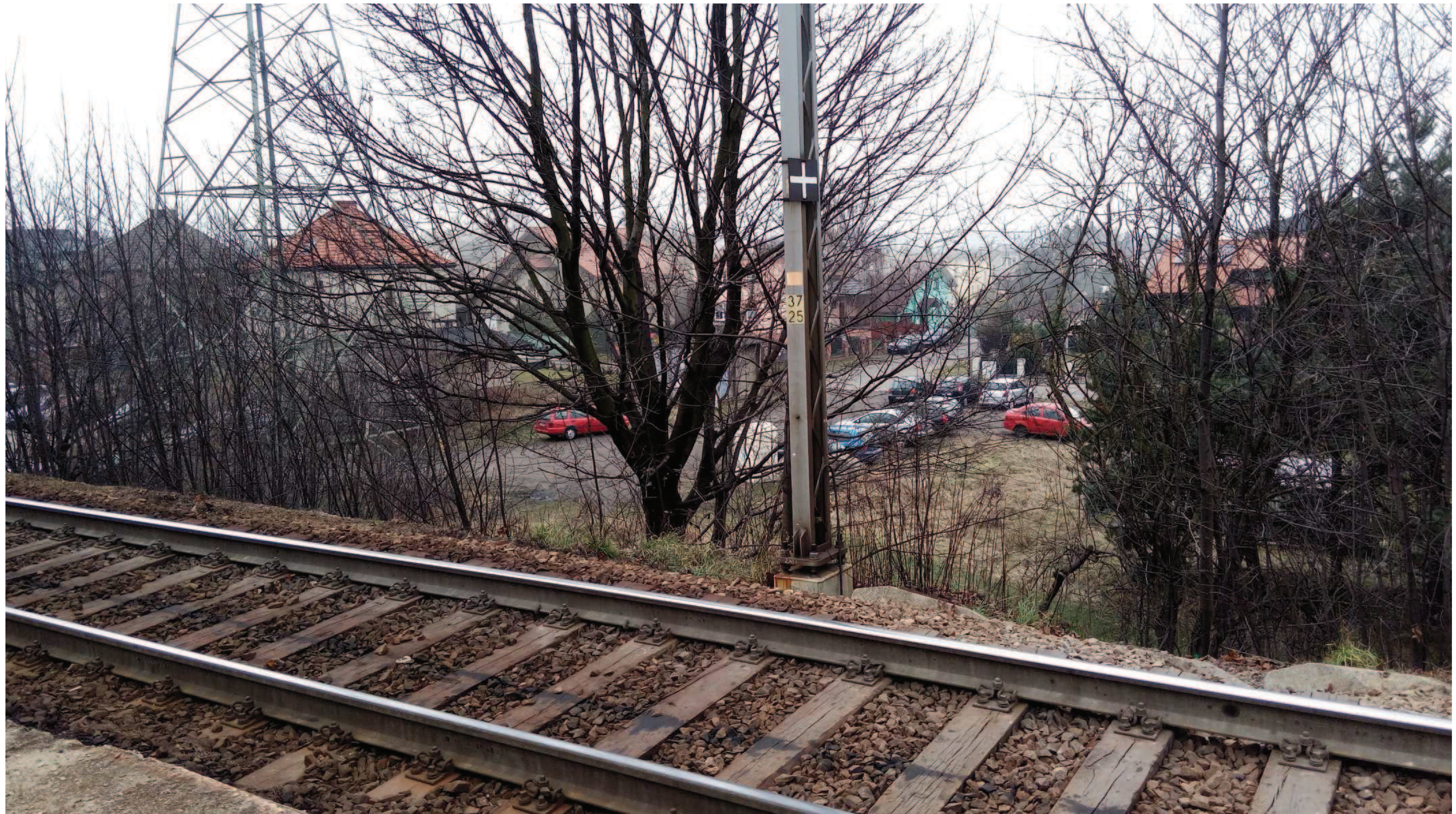
Widok od strony ul. Żużlowej/Pod Wałem (4) z nasypu (2) – od strony stacji kolejowej