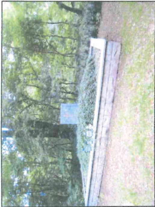
Fot. 3 Mogiła zbiorowa, w tle proponowane do ochrony drzewo