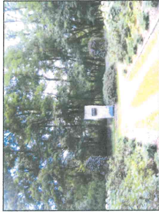
Fot. 6 Pomnik Pamięci Ofiar Oświęcimia, drzewo rośnie na północ od pomnika