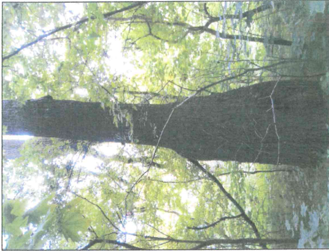
Fot. 2 Dąb szypułkowy proponowany do objęcia ochroną, widok od strony Młynówki