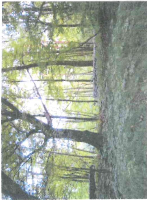
Fot. 4 Otoczenie terenu gdzie rośnie pomnikowy dąb