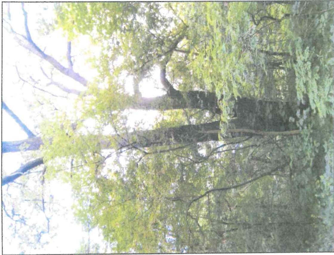
Fot. 1 Dąb szypułkowy proponowany do objęcia ochroną, widok od strony pomnika