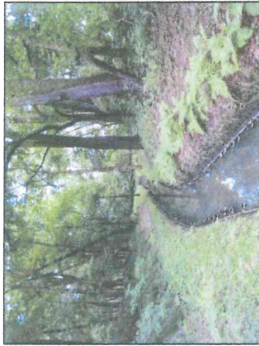
Fot. 5 Młynówka płynie na zachód od proponowanego do ochrony drzewa