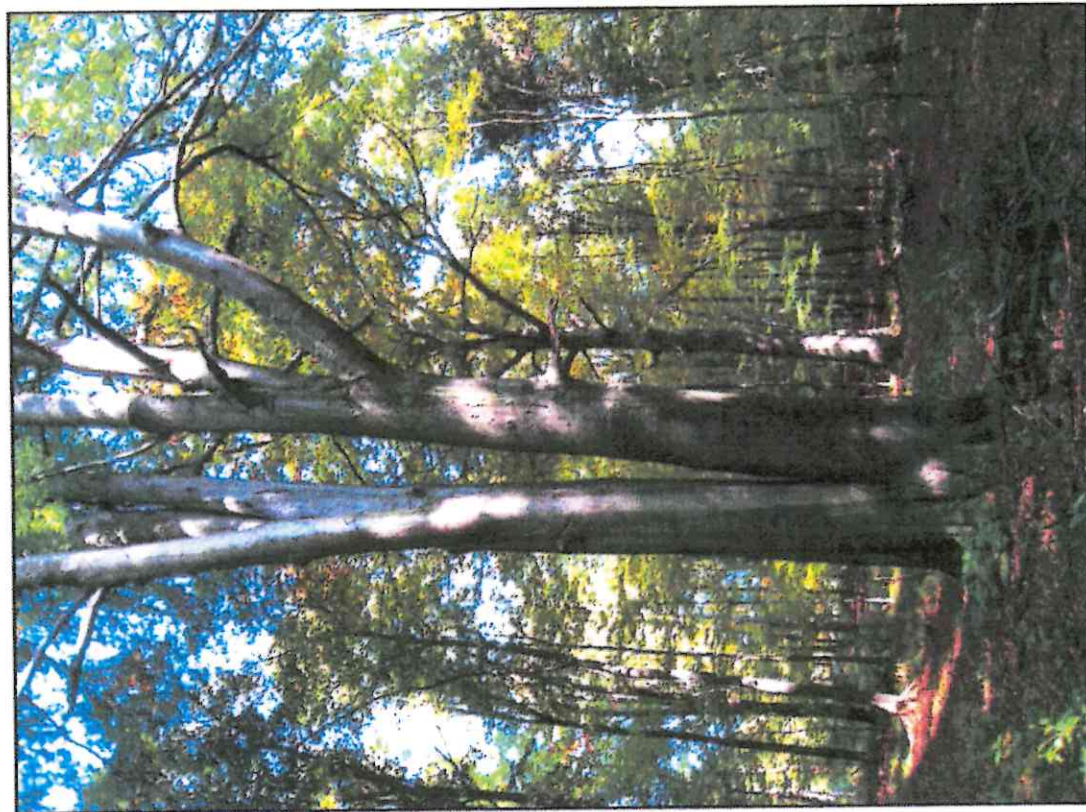
Fot. 1 Buk nr 1 o rozmiarach pomnikowych w Lesie Maliga (położony przy dawnym czerwonym szlaku)