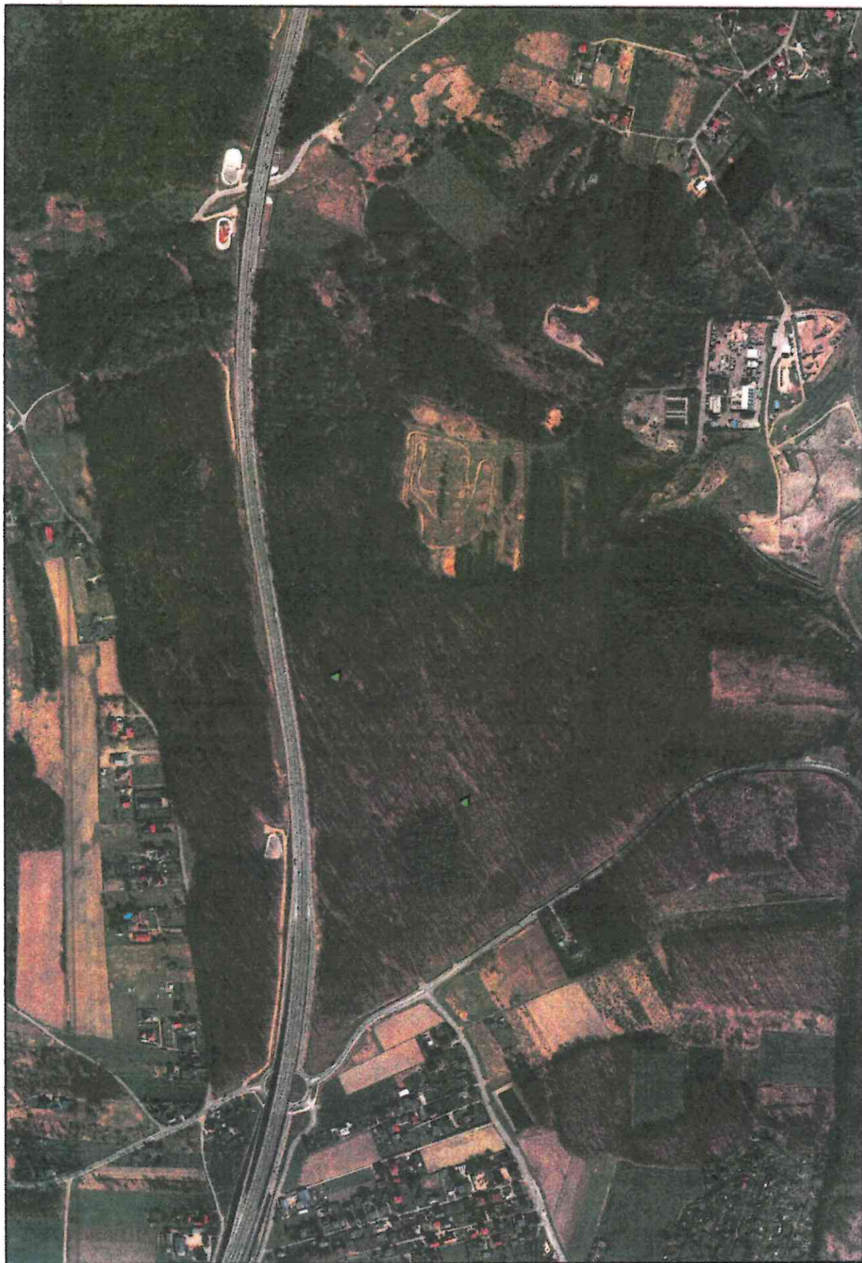
Załącznik 1 do uchwały nr... Rady Miasta z dnia ... r. - Lokalizacja pomników przyrody na podkładzie ortofotomapy