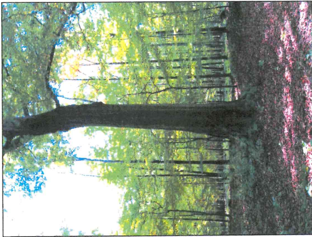
Fot. 2 Buk nr 2 o rozmiarach pomnikowych w Lesie Maliga (położony bliżej ul. Tkoczów)