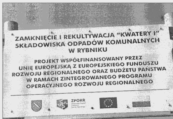
Zdjęcie nr 3 – Tablica pamiątkowa

Ze względu na fakt, iż rzeczowy zakres projektu zrealizowany został przed podpisaniem umowy o dofinansowanie, Beneficjent nie umieszczał w prasie informacji o współfinansowaniu inwestycji przez Unię Europejską oraz budżet państwa.