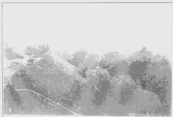
Zdjęcie nr 1 – Prace rekultywacyjne

Zamieszczone poniżej zdjęcia przedstawiają przedmiot projektu: