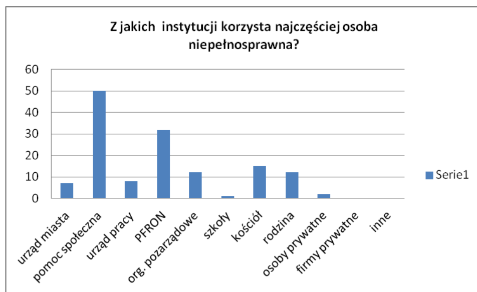
Wykres 1. Z jakich instytucji najczęściej korzysta osoba niepełnosprawna

Źródło: Badania własne Ośrodka Pomocy Społecznej w Rybniku