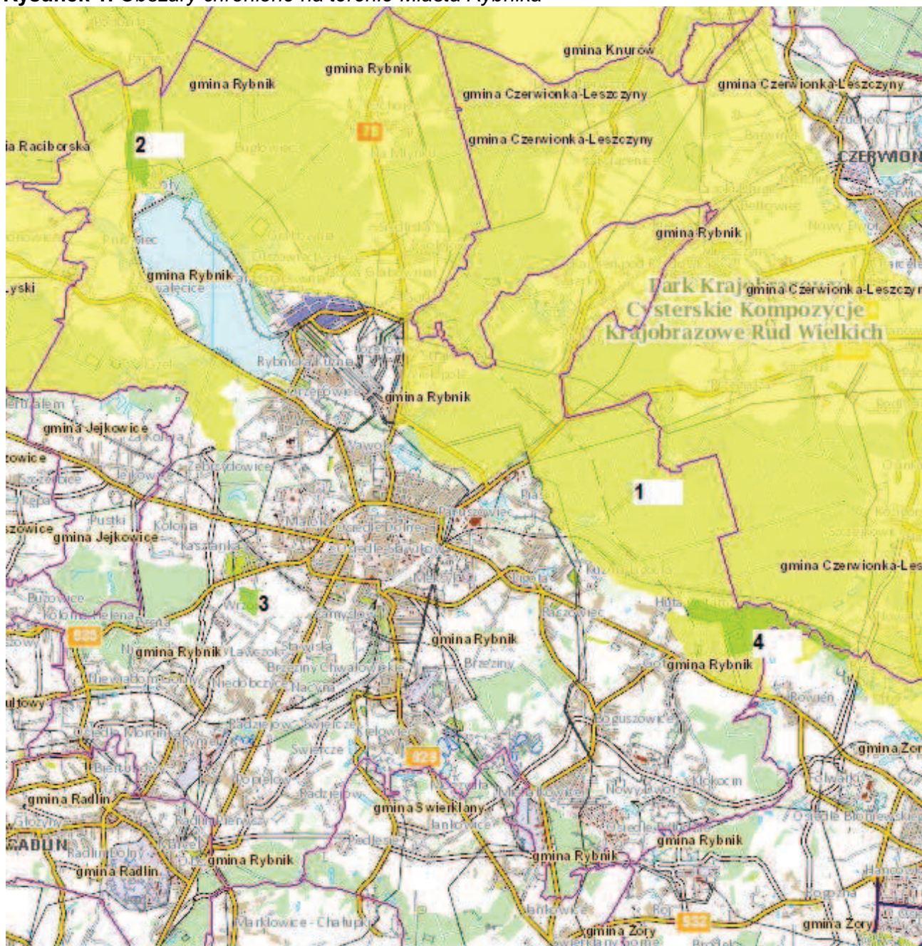
Rysunek 1. Obszary chronione na terenie Miasta Rybnika