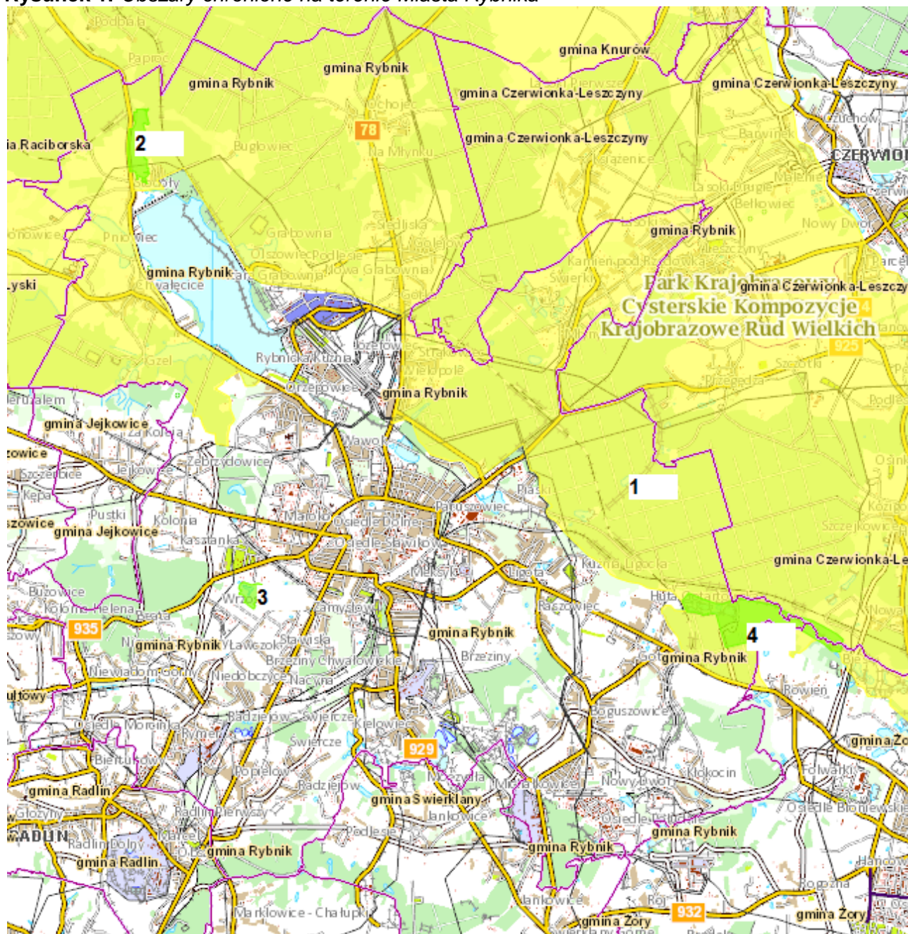
Rysunek 1. Obszary chronione na terenie Miasta Rybnika